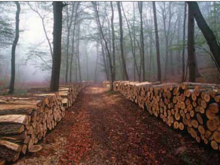
Im Wald gelagertes Brennholz trocknet langsamer aus; es besteht die Gefahr des „Verstockens“