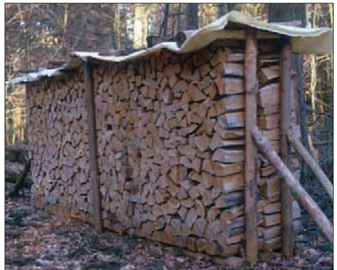
Vorbildlich gelagertes Brennholz

Erste Ansprechpartner für Energieholz sind die Zusammenschlüsse der Waldbesitzer. Adressen hierzu finden sie unter „ www.forst.bayern.de “, Rubrik „für den Waldbesitzer“.